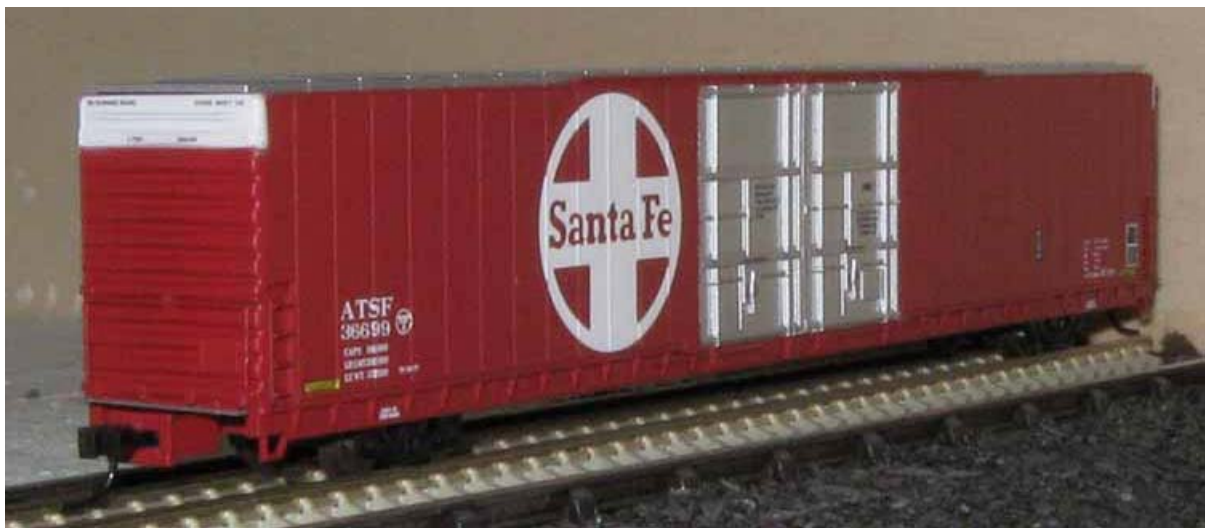
Bluford N 86' Auto Part Boxcar div. Gesellschaften