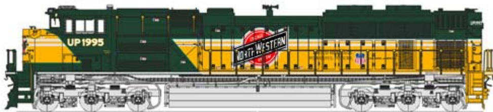
Kato EMD SD70ACe div. Ausführungen