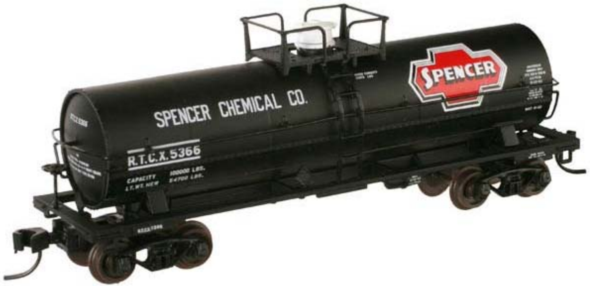
Atlas N 11,000gal. Tankcars div. Gesellschaften