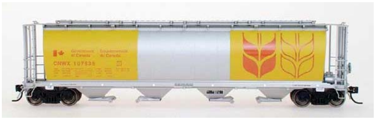
Intermountain cyl. cov. Hopper div. Gesellschaften