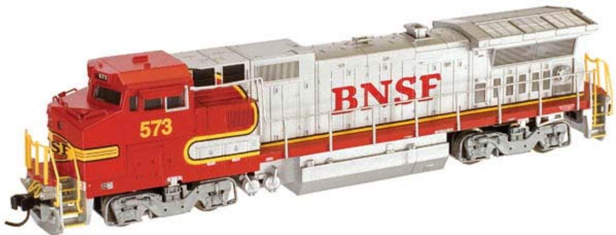
Atlas N GE Dash 8-40B div. Gesellschaften ohne Decoder