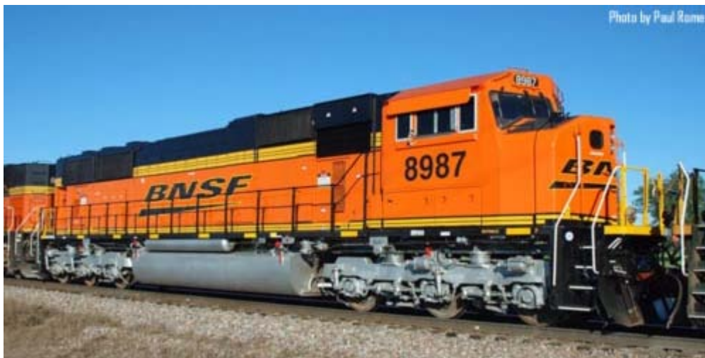
Kato EMD SD70MAC_BNSF "Swooch" mit Nose und Cab-Headlight