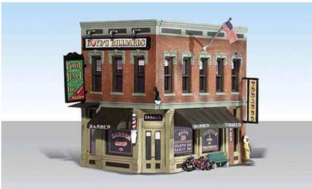
Woodland N Gebäude div.

Beachten Sie auch unsere Angebote für Gleise von Peco , Atlas , Gebäude von Walthers und unsere DVDs .