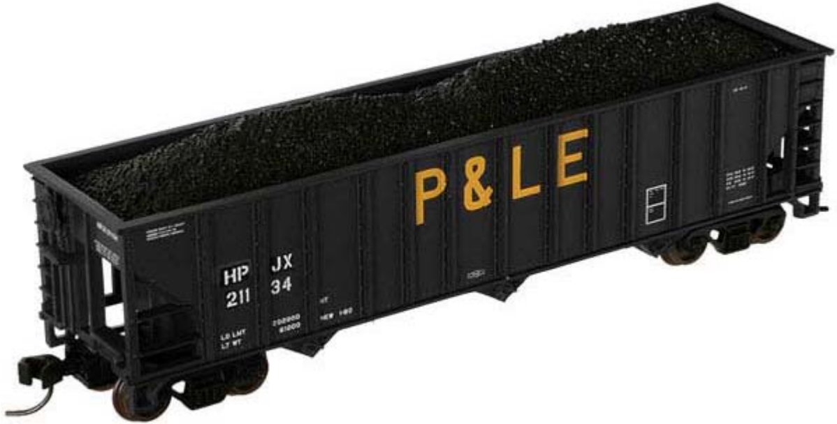
Trainman N 90 ton Hopper div. Gesellschaften