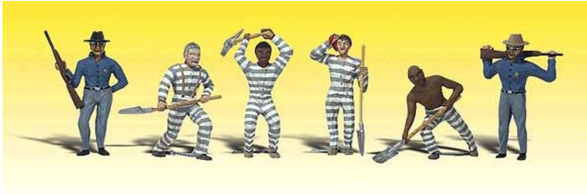
Woodland N Figuren