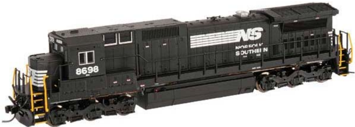
Atlas N GE Dash 8-40C div. Gesellschaften ohne Decoder