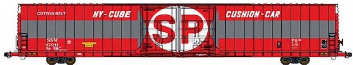
Bluford Shops 86' Auto Parts Boxcars div. Gesellschaften