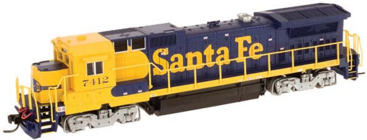
Atlas N GE Dash 8-40B div. Gesellschaften mit Decoder