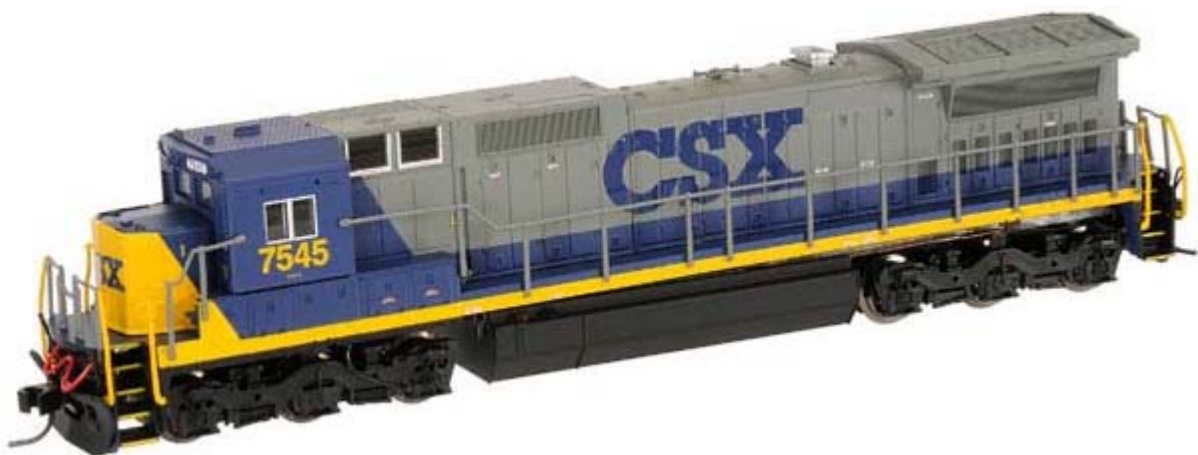
Atlas N GE Dash 8-40C div. Gesellschaften mit Decoder