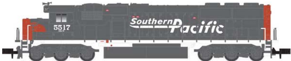
Atlas SD50 div. Gesellschaften ohne Decoder