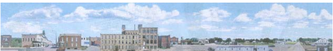
Sceniking N Hintergründe div. Ausführungen