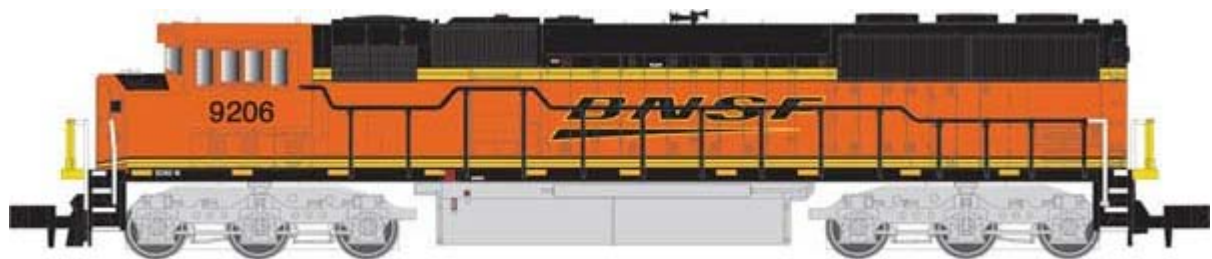
Atlas SD60 und SD60M div. Gesellschaften ohne Decoder