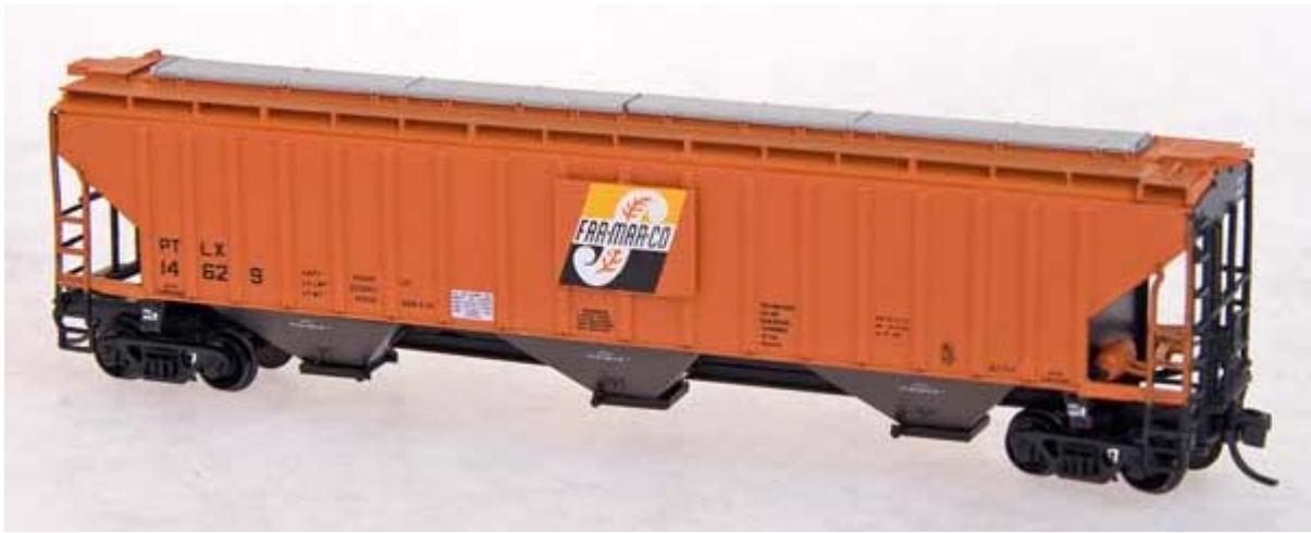
Intermountain N div. cov. Hopper