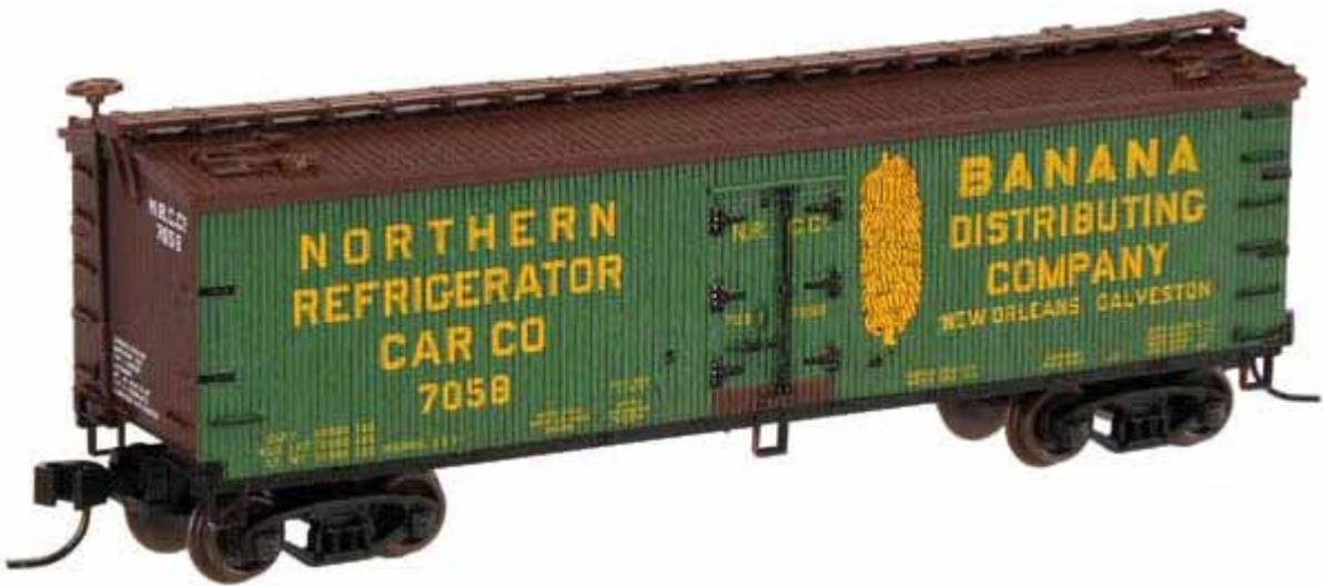
Atlas N 40' Wood Reefer div. Gesellschaften