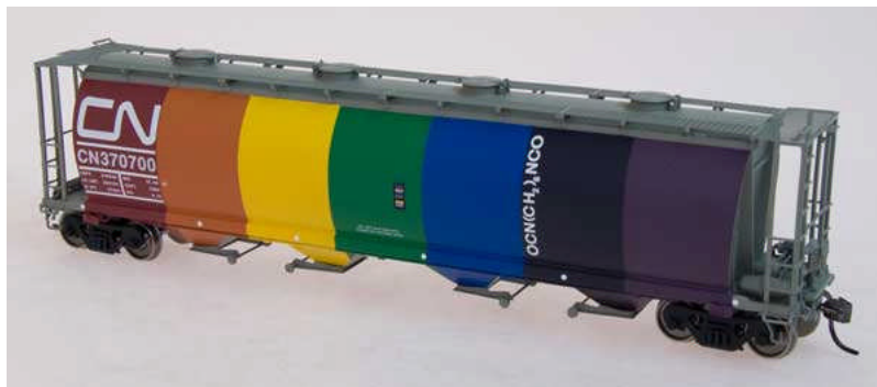
Intermountain HO Cylindrical Covered Hopper CN Rainbow Euro 27,50