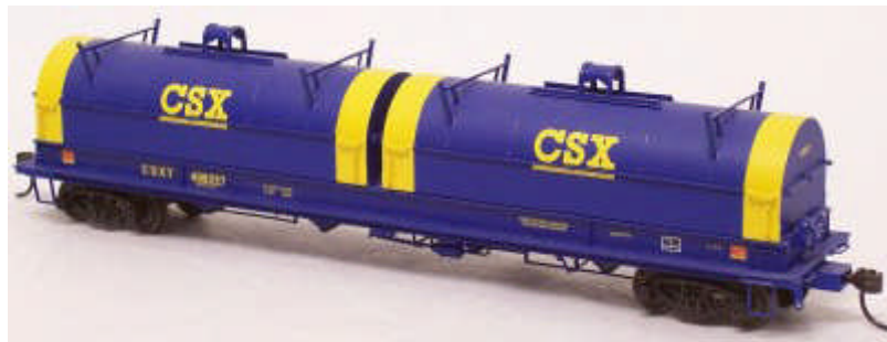
Intermountain HO Red Caboose Coilcars CSX, NS, ATSF, BNSF Euro 33,90