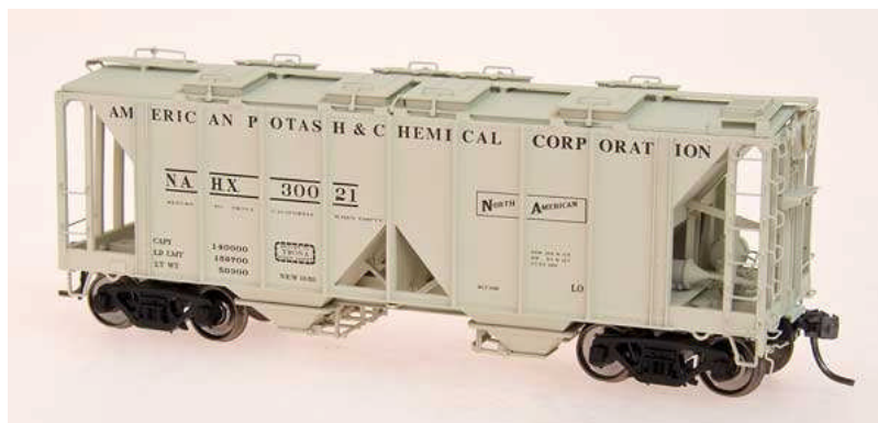
Intermountain HO 1958 Cu. Ft. 2-Bay Hopper SC, AP&C, SP Euro 27,50