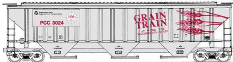
Intermountain HO 4750 Cubic Foot Rib-Sided (18 Rib) 3-Bay Covered Hopper Grain Train - PCC, SSGX Euro 25,50