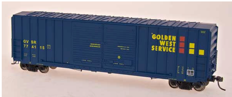
Intermountain HO FMC 5283 cu.ft. Boxcar Golden West Euro 26,50