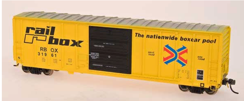
Intermountain HO P-S 5277 cu. ft. Boxcar Railbox early, late, WC, IMR restenciled Euro 26,50