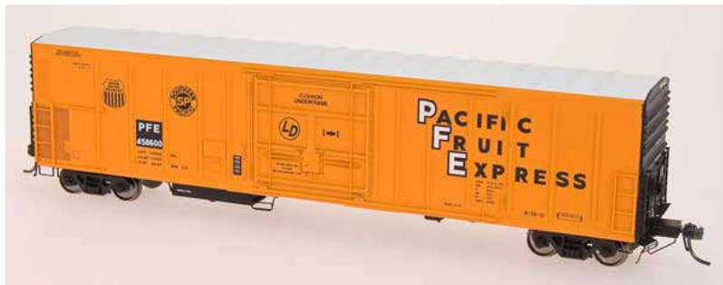
Intermountain HO R-70-20 Reefer Pacific Fruit Express - Late Roof & Keystone Cushion Underframe div Ausführungen Euro 27,90