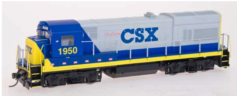
Intermountain HO Diesellok GE U18B mit Sound CSX, MC, P&W, SCL Euro 174,90