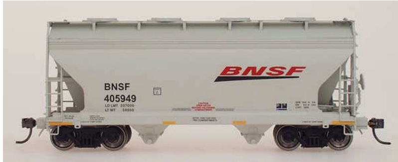
Intermountain HO ACF Center Flow 2-Bay Hopper BNSF Euro27,50